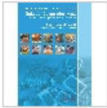
GUIA ANUAL DEL COMPRADOR - CENTRAL DE NEGOCIOS INTERNACIONALES-