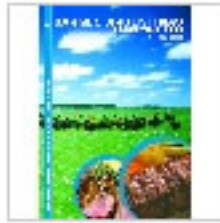
CATALOGO INTERNACIONAL DE CORTES ARGENTINOS