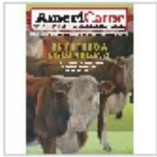
UN FUTURO A CIELO ABIERTO