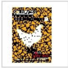
INVERTIR, DESARROLLAR, PRODUCIR, EXPORTAR, CRECER